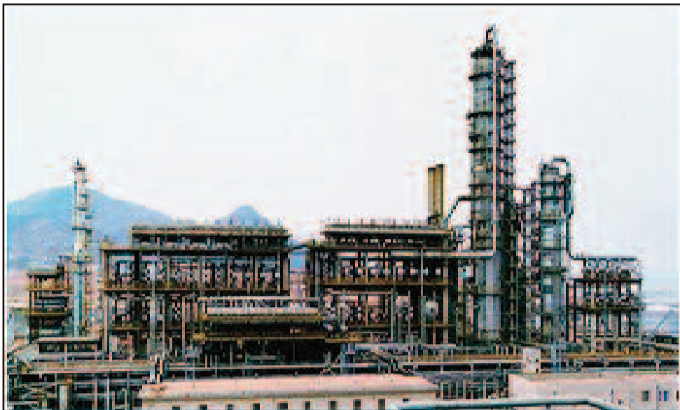
Raffinerie de Zinder

a été achevée en Septembre 2010. La construction des installations de surface principales a été achevée en