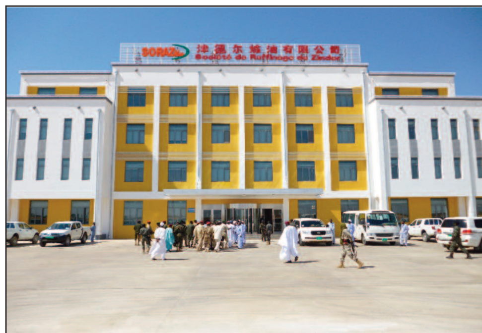
Siège national de la SORAZ

Décembre 2010. La CNPC et populations rurales a les Les actions sociales de grande portée comme la construction gratuite des classes et des puits dans les zones les plus reculées du Pays : Entre 2008 et 2010 CNPC a construit 2 classes à Agadez, 4 classes à Zinder, 1 classe à Abba, 1 classe à Mainé et 2 classes à Trouna. En 2011, CNPC a construit 1 classe à Abba, 1 classe à N'Guigmi. Notons aussi que 2 classes à N'Gourti et 2 autres à Zinder sont en finition. Par ailleurs et toujours dans le domaine du social, 4 puits ont été construits le long du pipeline dans la zone de N'gourti et un 5ème est en construction sans oublier la distribution de 11 tonnes de riz dans la région de Diffa.