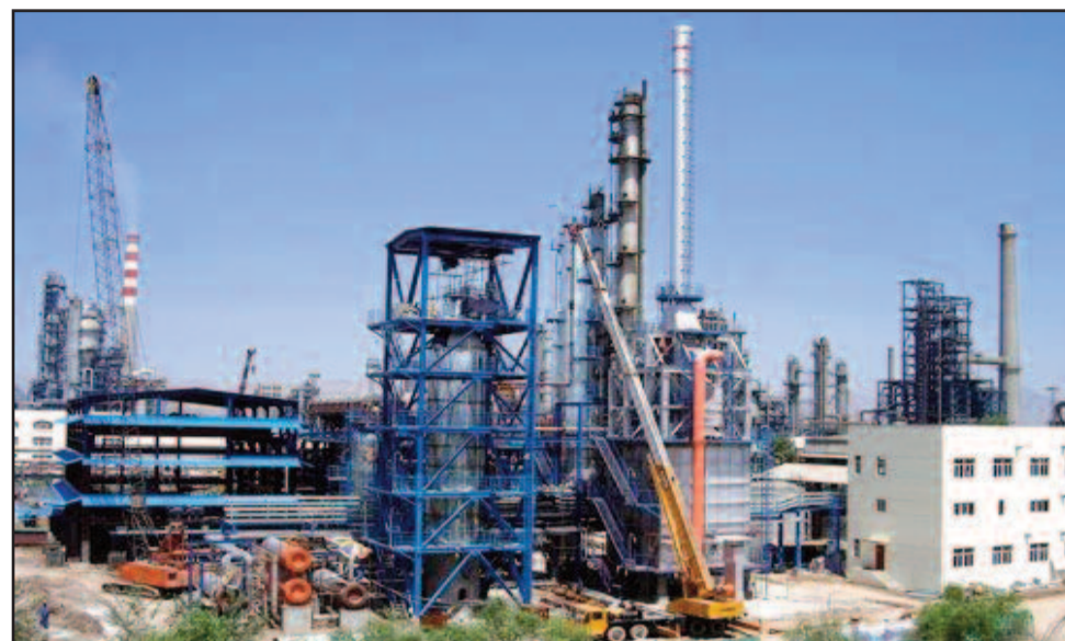
Raffinerie de Zinder

à Zinder d'où le lien avec son coût jugé exorbitant qui défraie la chronique. L'on introduisait le coût de certains travaux liés au nouvel emplacement. La CNPC devait alors forer des puits d'eau et réaliser des installations de canalisation, construire 26 puits, et réaliser la canalisation pour acheminer l'eau du forage à la raffinerie. Comme toute raffinerie moderne, celle de Zinder est composée des unités suivantes, une unité de distillation, une unité de Craquage Catalytique, une unité de reformage, une unité de traitement à l'hydrogène, une base vie, une centrale électrique d'une capacité de 24 MW, un projet d'approvisionnement en eau et un centre de vente. Concernant le coût de la raffinerie, il était convenu dans le CPP, un montant de 600 millions de $±30%. Le coût définitif devra être décidé suite au rapport de l'étude de faisabilité. Le premier modèle de la SORAZ était de 1200MM $, le deuxième de 1080Millions $, et le troisième approuvé par le Gouvernement était de 980Millions $. Déplacée de Niamey à Zinder, il a été inclus le coût de transport de 1000 Km. Si la raffinerie était construite à Niamey, on aurait réduit le coût du transport et celui du système d'approvisionnement en eau. Après négociations le Libor +3,5 est réduit à libor+3,01. Présentement la valeur du Libor est de 1,00756.