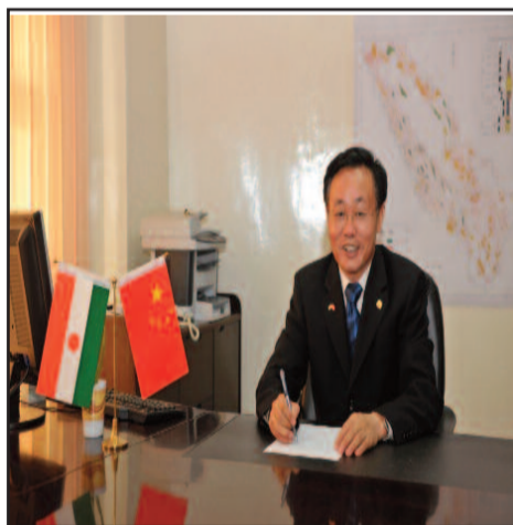
Le DGde la SORAZ

Toutefois, il est possible de faire de l'extension de cette raffinerie modulaire pour beaucoup d'autres produits. Les prix de vente sortie SORAZ Les prix de vente des produits raffinés à la SONIDEP sont : Gasoil = 340 f c f a / l , Essence = 336 f c f a / l , GPL = 1500 f / 12,5 kg .